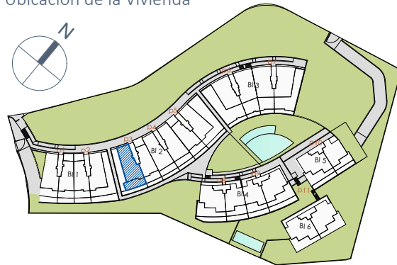
Ubicación de la Vivienda