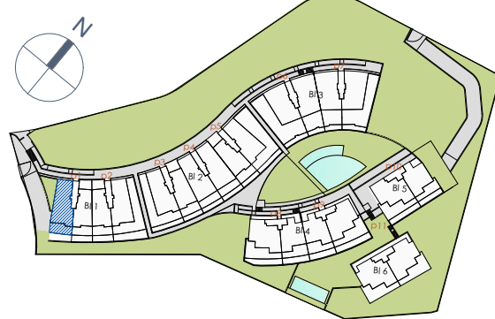
Ubicación de la Vivienda